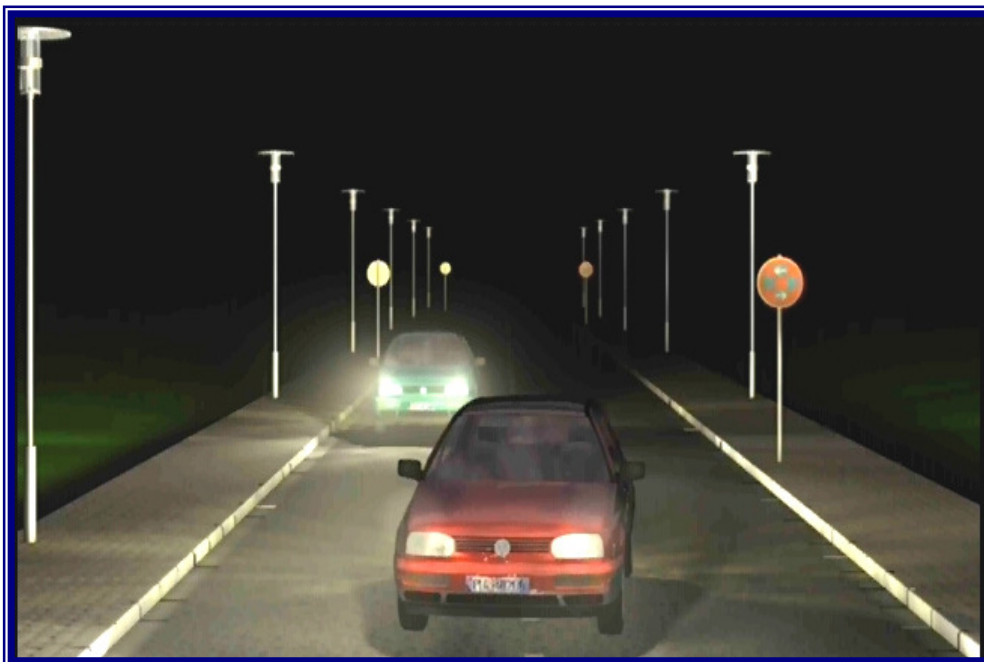
Standbild aus einer animierten 3D-Auswertung mit LASEC

LASEC (LAST SECONDS) ist eine "Black-Box" zur "Eins-zu-Eins"-Aufklärung von Verkehrsunfällen auf der Strasse. LASEC ermöglicht massstabsgetreue 3D-Bild- und Ton-Animationen der Ereignisse aus Optik eines fiktiven Zeugen. Dabei lässt sich der Unfallhergang beliebig, in Zeitlupe und mit frei wählbaren Beobachter-Standorten (auch mitfahrend) wiederholen. Distanz, Position, Geschwindigkeit, Rotation und Beschleunigung der beteiligten Fahrzeuge lassen sich später präzise rekonstruieren und nachweisen.